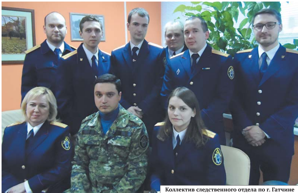
Коллектив следственного отдела по г. Гатчине

Следственный отдел по г. Гатчине следственного управления Следственного комитета Российской Федерации по Ленинградской области занимается расследованием тяжких и особо тяжких преступлений. Пяту часть коллектива следственного отдела составляют представительницы прекрасного пола, которые трудятся наравне с мужчинами и с достоинством справляются с этой нелегкой работой. Как им это удается?